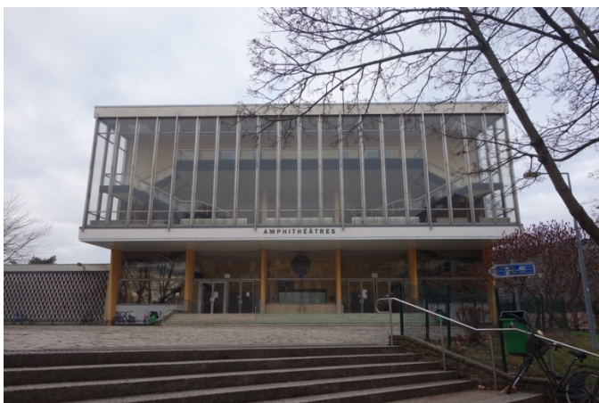
Faculté de médecine