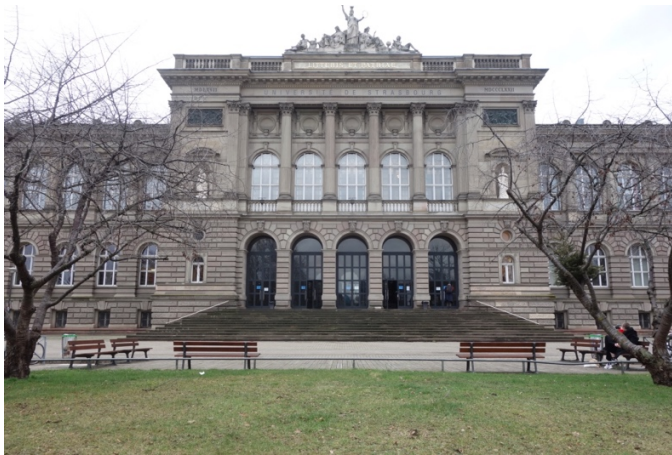
Palais universitaire