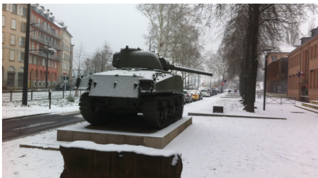
Souvenir d'un passé mouvementé, quartier du port du Rhin.