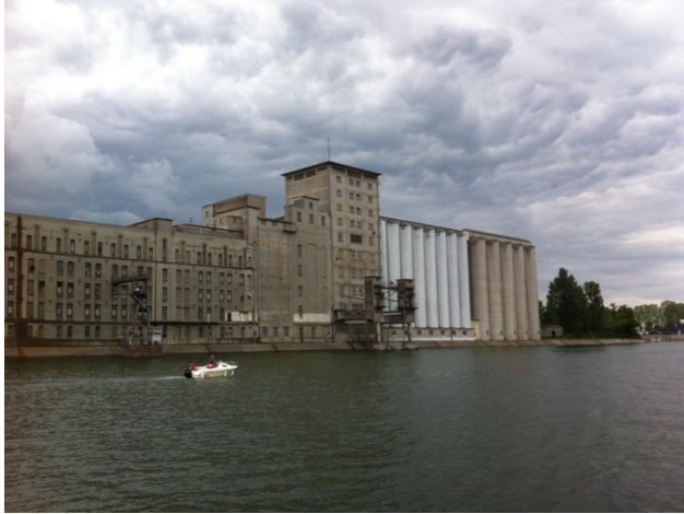
L'imposant silo à Grain du Port du Rhin.