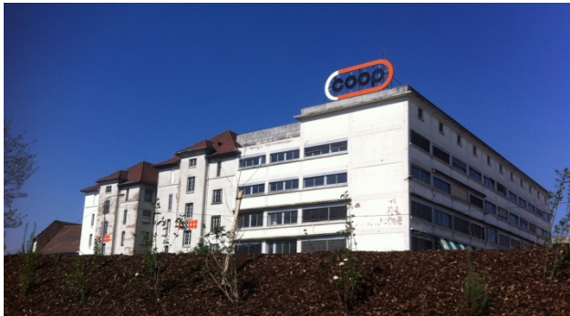
La friche de la COOP un quartier en devenir