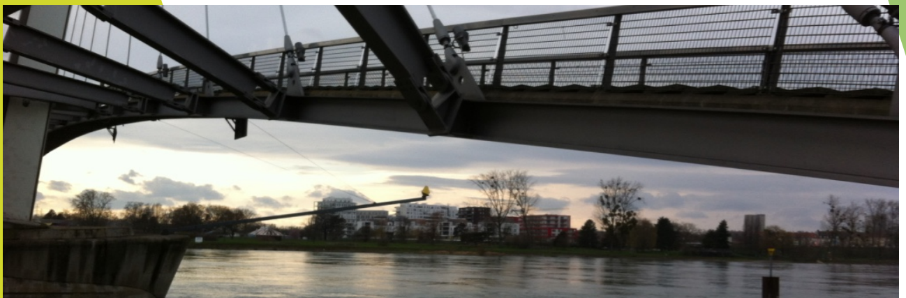
Vue de la passerelle entre France et Allemagne (Image : Tristan Siebert).

Le projet est également l'occasion de mettre en œuvre des transformations du système de transport transfrontalier. Au cœur de l'ensemble des Deux-Rives ce qui était il y a encore quelques années une voie rapide de cinq kilomètres de long, est devenu une avenue, bordée d'un tramway, voulu comme élément structurant du développement. Cette dernière est l'épine dorsale d'un ensemble d'opérations d'aménagement, constituée de près de trois ZAC. Celles ci devraient à terme accueillir près de 1 400 000 mètres carrés, de 200 000 habitants et pas moins de 8500 emplois. Il constitue à ce jour le plus grand projet urbain local depuis l'achèvement de la Neustadt. Située entre le fleuve et le môle de la citadelle, la dernière phase sera l'objet de cette déambulation. La visite permettra aussi de prendre connaissance avec la SPL des Deux-Rives acteur majeur de cette transformation.