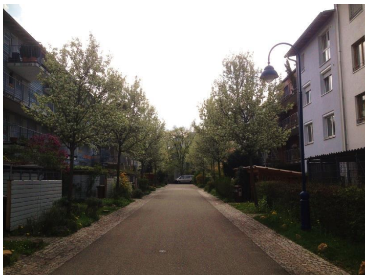
Vue sur une des allées du Quartier Vauban - Caline Ly Keng

Réalisation emblématique et vitrine européenne de l'application du développement durable au sein des villes, l'Eco-quartier Vauban couvre 40 hectares pour près de 5 500 habitants, à quelques minutes en tram seulement du centre-ville de Fribourg. Ancienne caserne militaire occupée par les Forces françaises stationnées en Allemagne, le départ des militaires en 1992 a enclenché un projet de reconversion des douze anciens bâtiments du site en logements. Sur les terrains restants, la ville a construit au fur et à mesure de nouveaux bâtiments de plus en plus innovants en matière de construction écologique mais également en terme de concertation autour du Forum Vauban et des associations de particuliers, les Baugruppen . Les groupes de travail composés d'experts et de citoyens qui ont travaillé sur le projet ont souhaité intégrer des initiatives sur l'énergie, la mobilité, l'architecture, l'écologie ou encore la vie citoyenne. Encore aujourd'hui, le quartier Vauban continue d'attirer de nouveaux habitants chaque année pour sa qualité de vie, mais également près de 15 000 visiteurs annuels, simples curieux ou professionnels en quête d'inspiration.